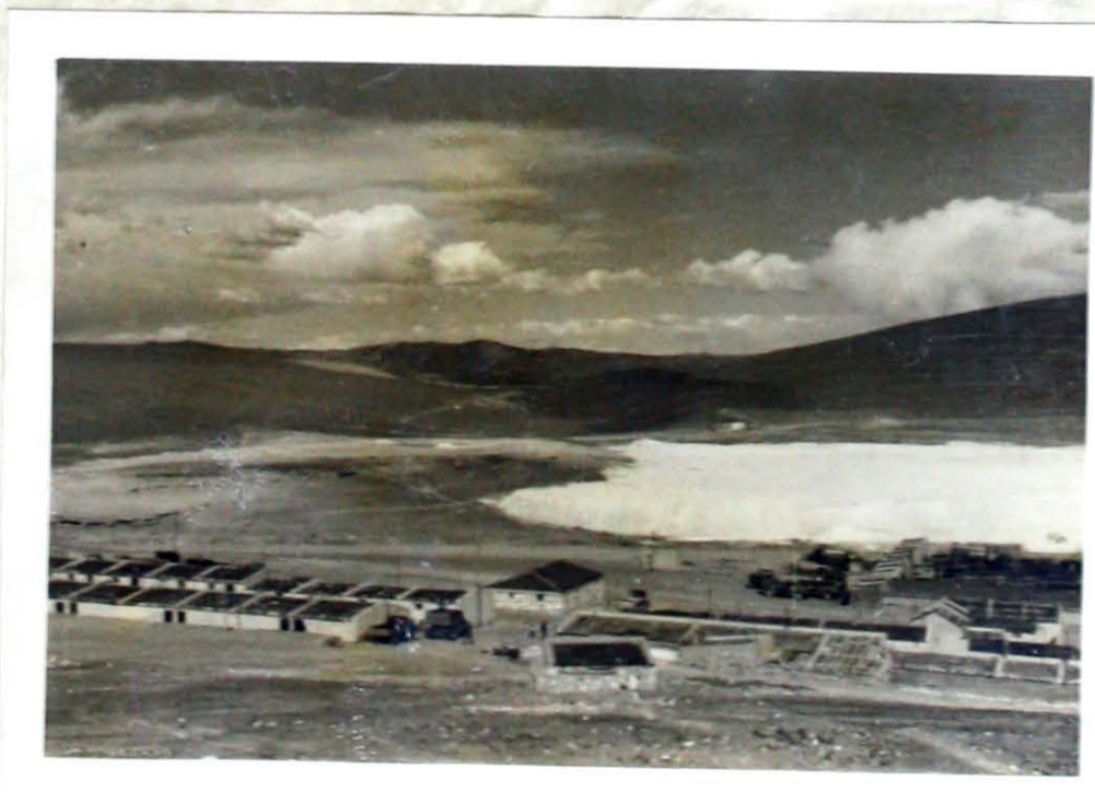
2. Idem, pero mostrando el sector norte del establecimiento. Nótese el depósito de cenizas (con azufre) que se piensa recuperar con la planta de flotación.