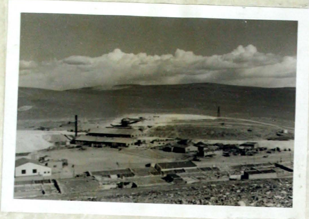
1. Vista del Ingenio La Casualidad, tomada hacia el E. En primer plano casillas destinadas a oficinas y viviendas, en el borde izquierdo, la usina. En el centro la planta donde se beneficia del azufre; a la derecha torre terminal del futuro alambre carril que unirá la planta con la mina (16 km. de distancia).