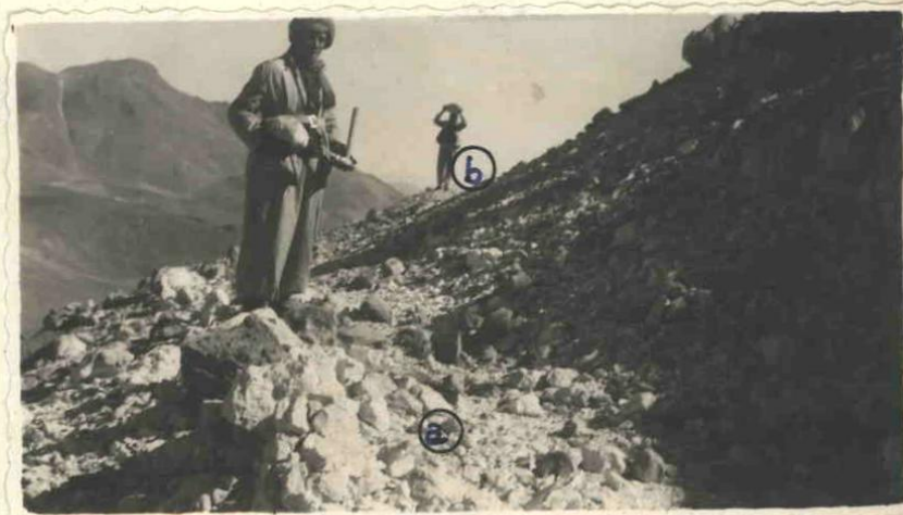
FOTO Nº 2 - Principales afloramientos de azufre en el Cº Niño - Mina "Iramain".-