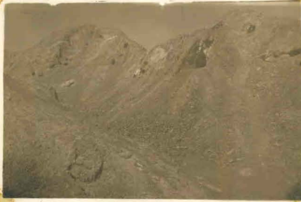
Vista parcial de las labores de extraccion de mineral