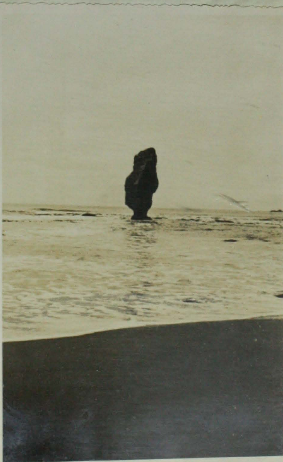
e) - Vista de la Piedra Botella.