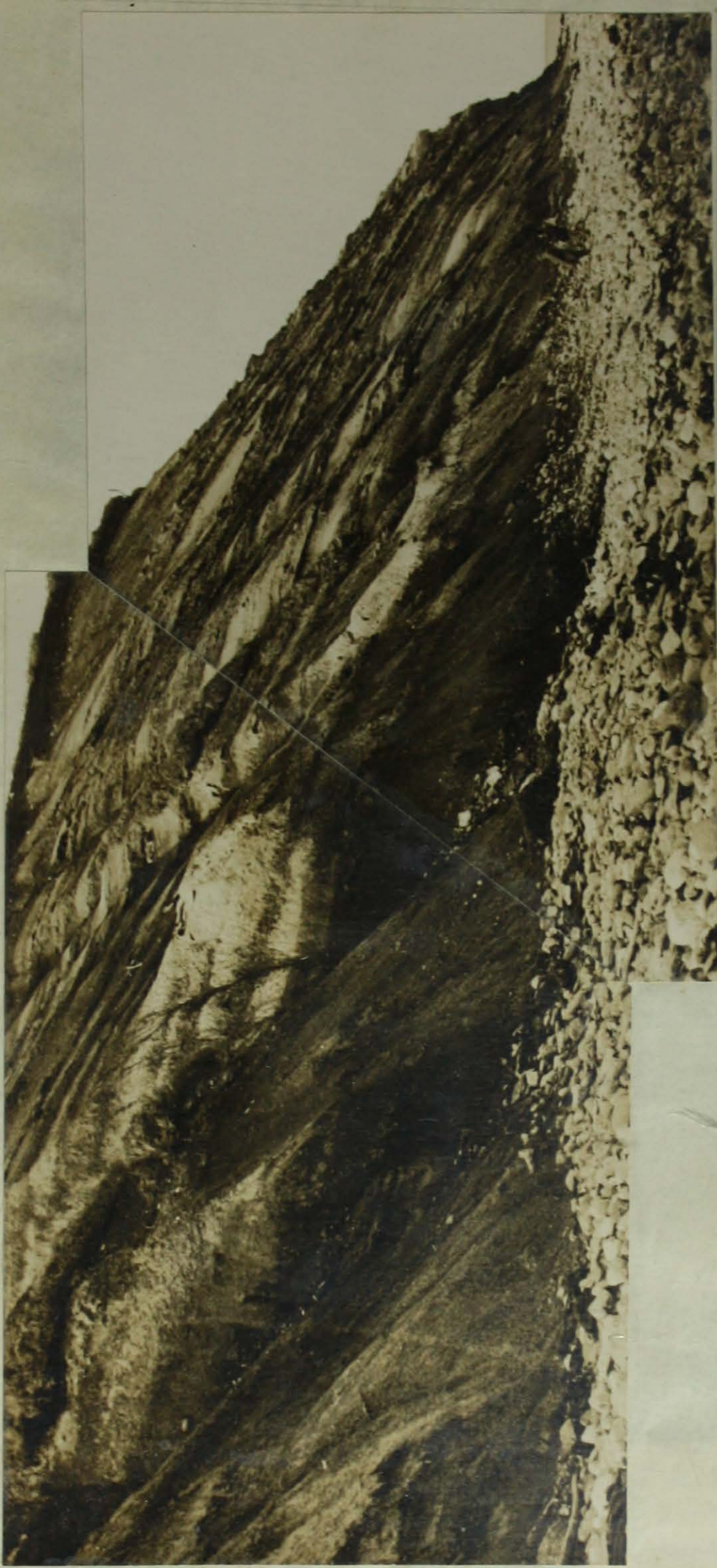
a) - Panorámico del complejo carbonífero. Las partes oscuras corresponden a las capas portadoras de carbón.