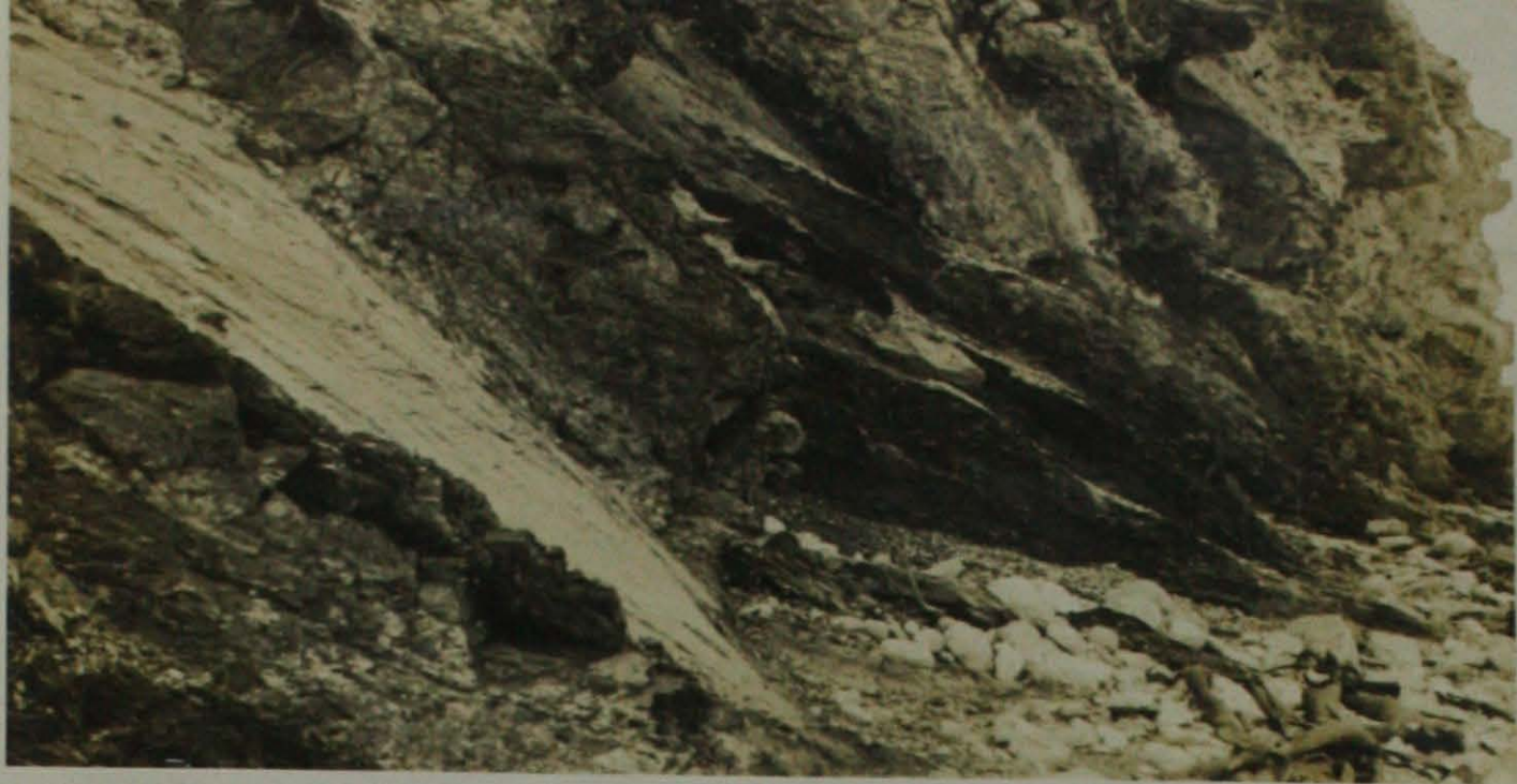
d) - Vista parcial de la serie carbonífera en su parte más saliente, donde podrá apreciarse la penetración de las capas carboníferas en el mar.