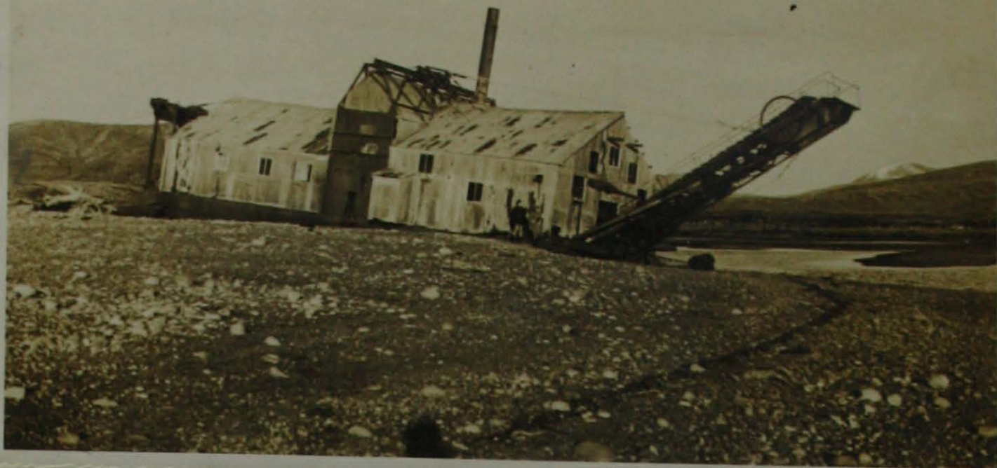
b) - Draga flotante para explotación de aluviones auríferos situada en la orilla derecha del Río López (Bahía Sloggett)