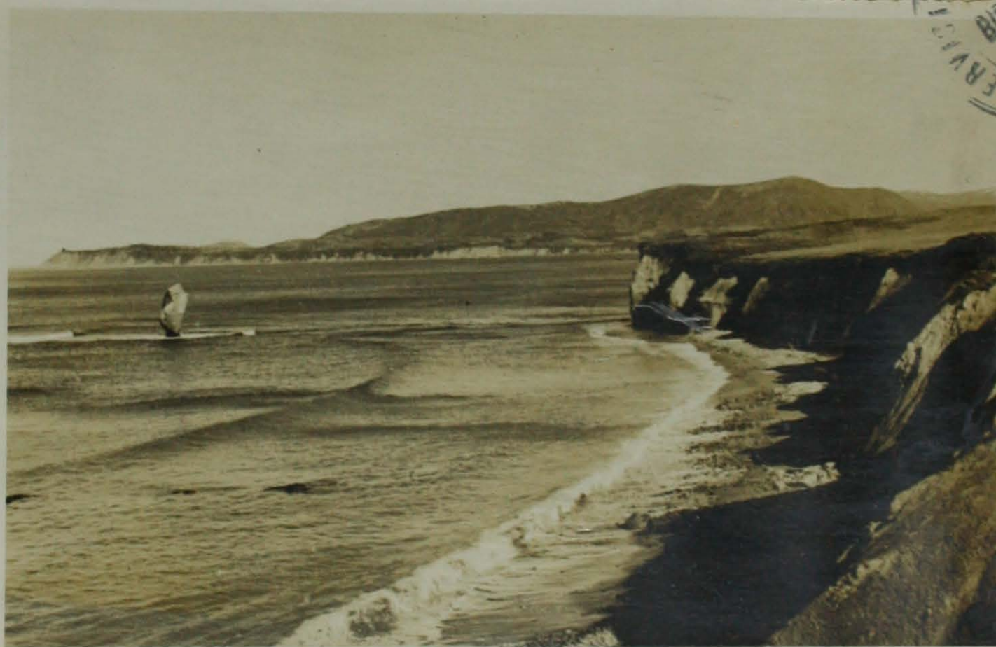
c) - Vista de Bahía Sloggett en las cercanías de Piedra Botella, tomada desde el complejo carbonoso.